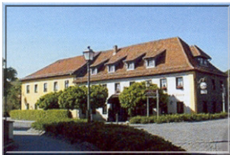
Gasthaus "Zum goldenen Löwen"